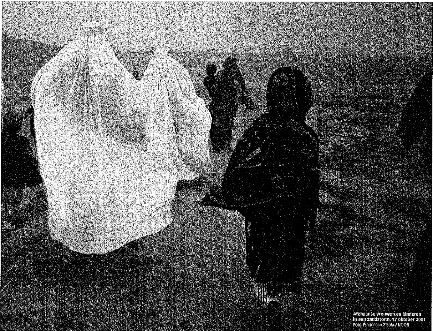
Afghaanse vrouwen en kinderen in een zandstorm, 17 oktober 2001