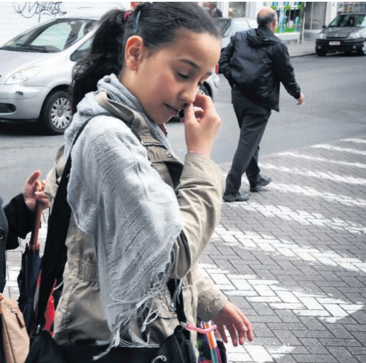
worden in de wijk met argwaan bekeken.