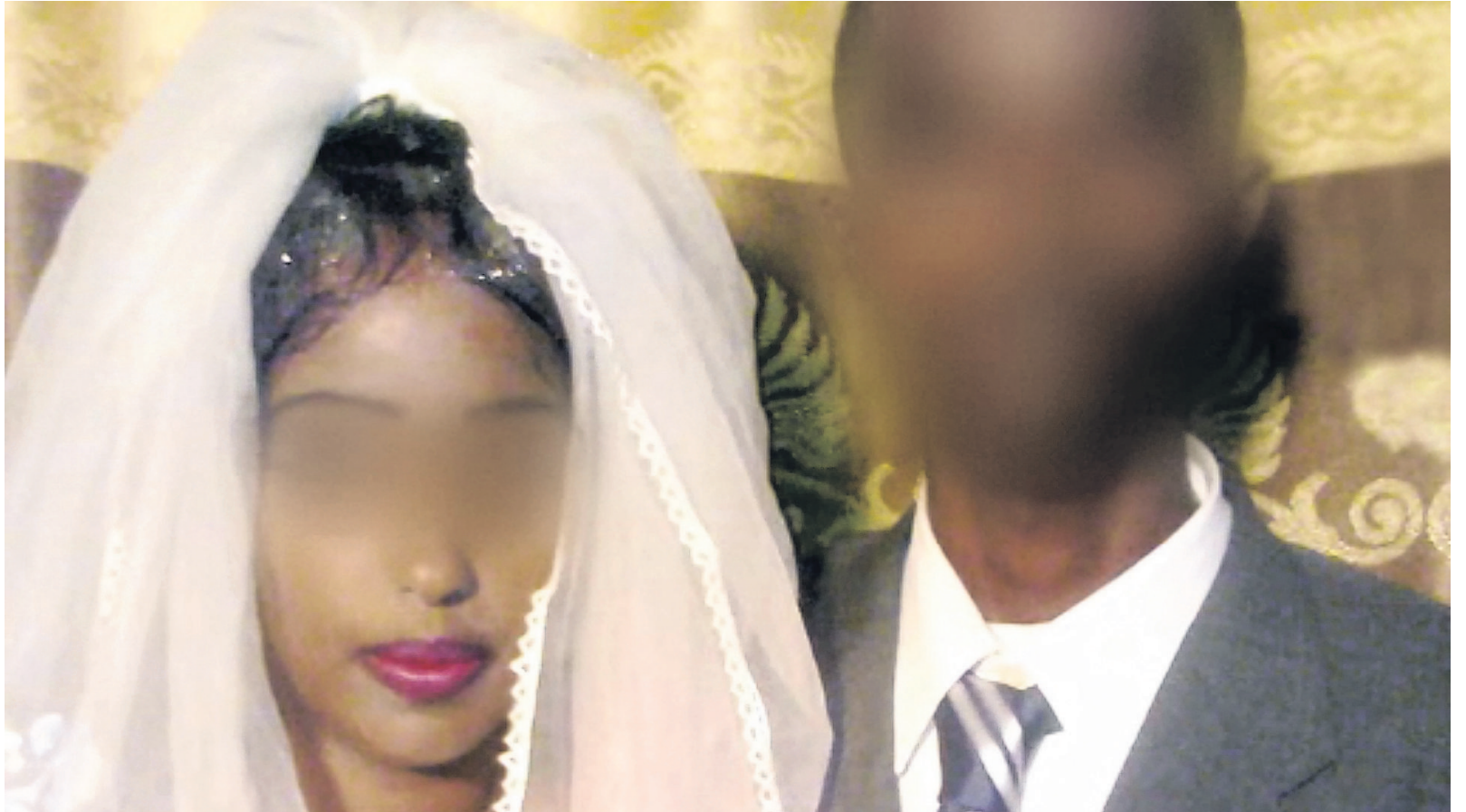
Sarahs uithuwelijking kwam al aan de orde in 'Nieuwsuur' van 13 augustus 2012.

"Hij deed twee weken niks. Maar op een dag werd hij helemaal boos. 'Ik heb al dat goud niet betaald om jou hier tv te laten kijken en jezelf