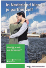
Een poster uit de Rotterdamse campagne voor het recht op vrije partnerkeuze.

Ook uit de linkse-, feministische- en anti-racismehoek kwamen de nodige negatieve reacties, die over-