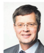
J.P. Balkenende was de laatste.

Het fundament van dit soort waar-schuwingen omdat alloctonen het niet aankunnen, is betutteling en generalisatie. Diversiteit is niets anders dan onderwets multiculturalisme met een nieuw sausje. Identiteiten liggen vast en verdienen bescherming, behalve de nationale. Iets anders vinden is niet gewenst. Het standpunt is een dogma geworden - VOC, niet in de haak. Punt. Remco Raben wou die er nog aan toe dat de Universiteit van